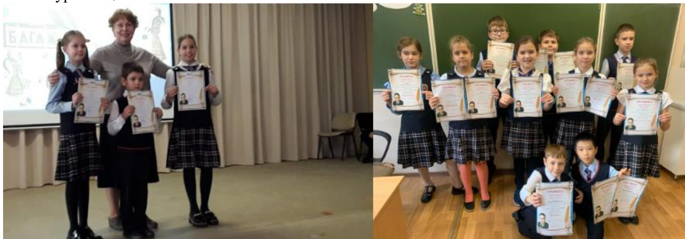
Декада математики, информатики и физики «МИФ»